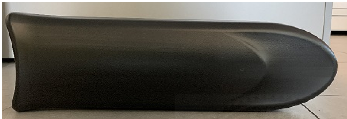
Photo vue de côté de la carrosserie latérale / Photo of the side of the bodywork