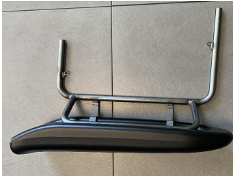
Photo vue de devant avec supports / Photo from the front with supports