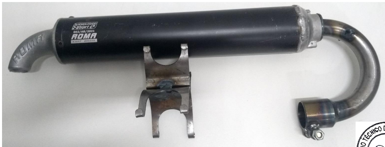
FOTO DO ABAFADOR MOSTRANDO A MARCA ESTAMPADA

Essa ficha reproduz descrições, ilustrações e dimensões do escapamento no momento da homologação pela CBA. O fabricante poderá não modificá-la. Somente a ficha de homologação poderá servir para identificar um produto homologado.